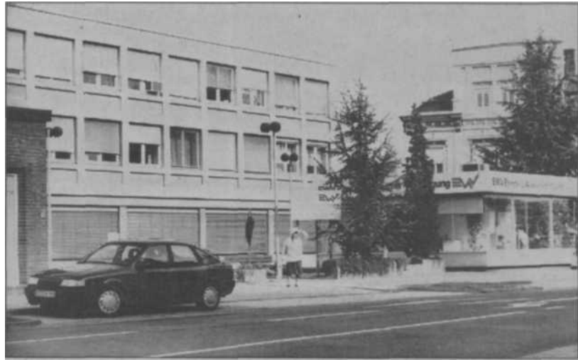
Die EWV-Betriebsstelle am Langwahn: Ende nächsten Jahres packen die letzten EWV-Mitarbeiter hier die Koffer, ziehen um nach Weisweiler.

Für das EWV-Gelände am Langwahn, das sich fast bis zur Jahnstraße erstreckt, hatte schon vor längerer Zeit ein Eschweiler Investor Interesse gezeigt, wollte hier auf dem parkähnlichen Areal Wohnungen und Sportmöglichkeiten schaffen. Was geschieht mit dem demnächst ebenfalls nicht mehr benötigten Gebäude und Gelände an der Aachener Straße?